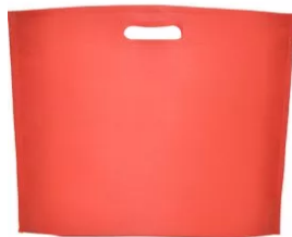
7501 Bolsa Ocean