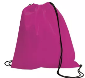
V512 Bolsa de polyester 210T, con corchetes metálicos reforzados