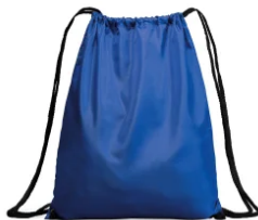
7114 Mochila Hamelin