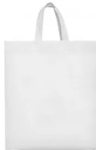
7503 Bolsa Lake