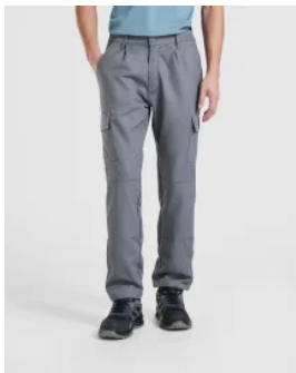
5096 Pantalón laboral Safety Roly