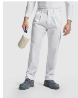
Pantalón Laboral Daily Roly