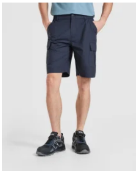
6715 Bermuda Amazonas Roly