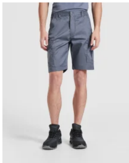
6725 Bermuda Armour Roly