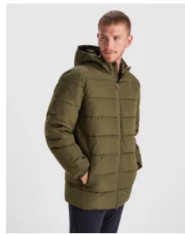
5080 Parka NEPAL Roly