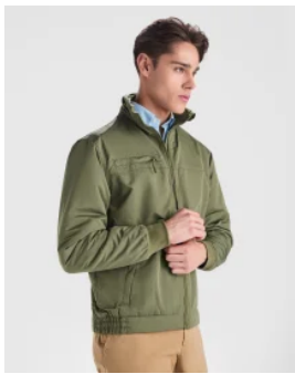
1108 Chaqueta Yukon Roly