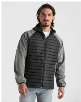
1120 Chaqueta Minsk Roly