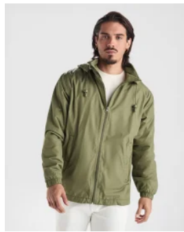
5079 Chaqueta MAKALU Roly