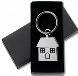
L280 Llavero casa