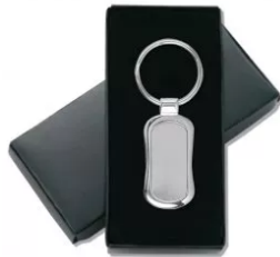
L630 Llavero de metal