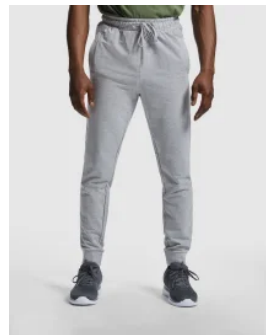
1174 Pantalón Chándal Adelpho Roly