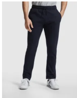
1173 Pantalón New Astún Roly