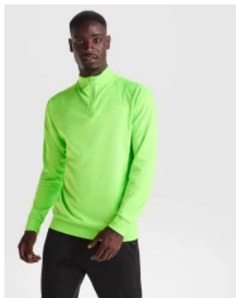
1115 Sudadera Epiro Roly