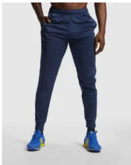
0460 Pantalon Argos Roly