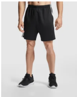
0418 Bermuda LAZIO Roly