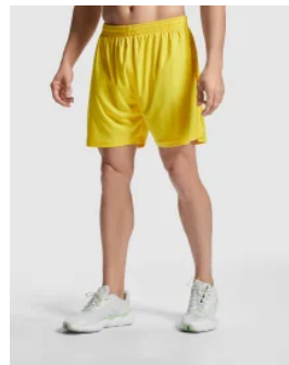
0484 Pantalón Deportivo Calcio Roly