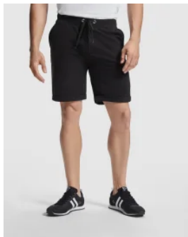
0449 Pantalón Corto Deportivo Spiro Roly