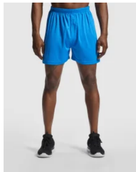
0453 Pantalon Corto Player Roly